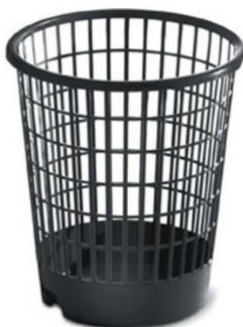
Figura 2 – Modelo de residuário utilizado no setor industrial